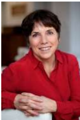
Dr. Margot Käßmann.