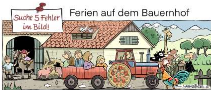
Einhorn, Zylinderhut, Pizza, Giraffe, Plauer